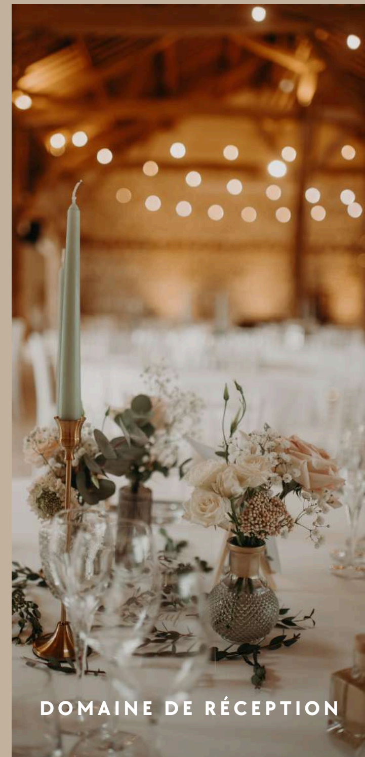
DOMAINE DE RÉCEPTION